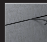
KRIMPNAADVOEG FP 430