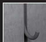
BEWEGINGSVOEG FP 410